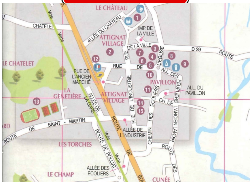
ATTIGNAT – Centre Village