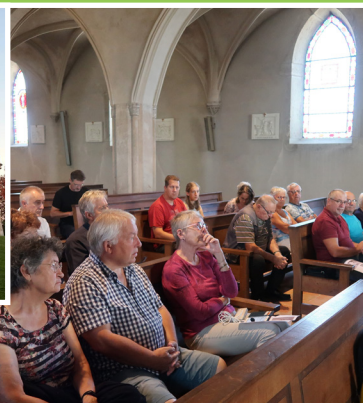
Conférence «Eglise Saint Loup»