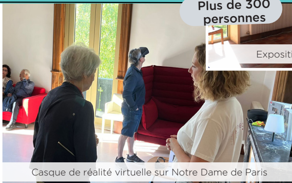
Casque de réalité virtuelle sur Notre Dame de Paris