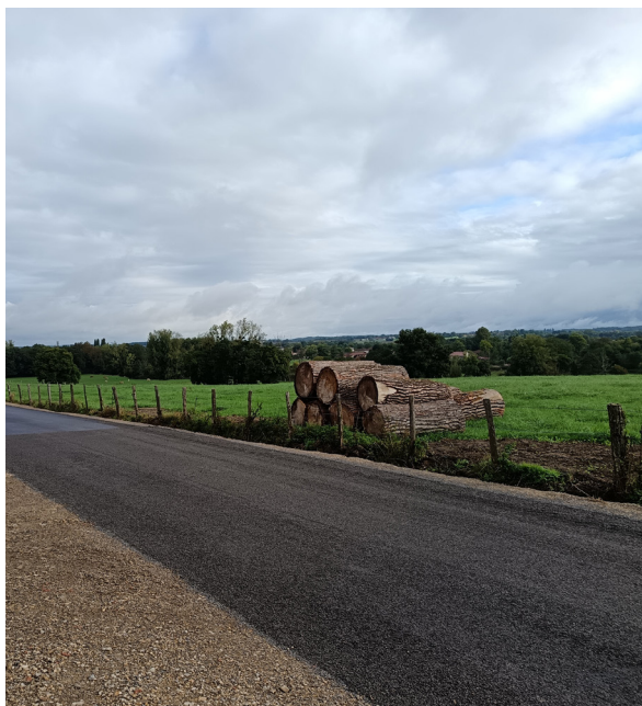
Photo : réfection du chemin des Baudières

L'état de nos voiries communales a nécessité un effort budgétaire important cette année. A de nombreux points du territoire, des réfections et améliorations de nos chaussées ont été réalisées.