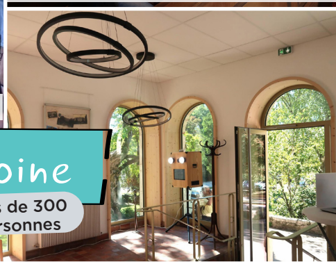
Exposition sur le Château de Salvart