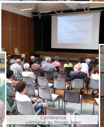
Conférence «Attignat au Moyen âge»