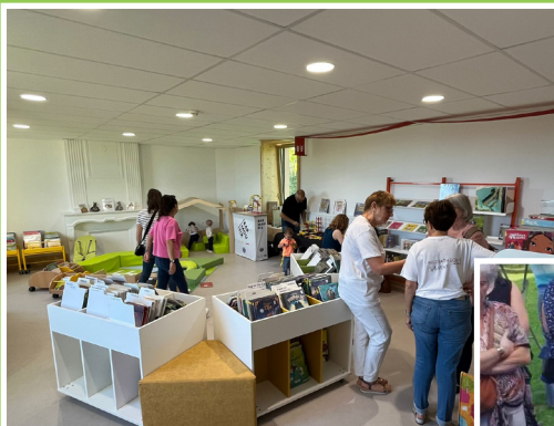
Portes ouvertes à la médiathèque (jeux, dédicaces...)